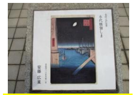
隅田川テラス/安藤広重