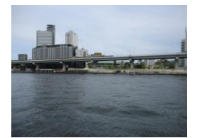
右岸テラスから両国方面

「柳橋 所在地 中央区東日本橋二丁目・台東区柳橋一丁目(神田川) 柳橋は神田川が隅田川に流入する河口部に位置する第一橋梁です。その起源は江戸時代の中頃で、当時は下柳原同朋町(中央区)と対岸の下平右衛門町(台東区)とは渡船で往来していましたが、不便なので、元禄十年(1697)に南町奉行所に架橋を願い出て許可され、翌十一年に完成しました。(中略)明治二十年(1887)に鋼鉄橋となり、その柳橋は大正十二年(1923)の関東大震災で落ちてしまいました。復興局は(中略)、ドイツ・ライン河の橋を参考にした永代橋のデザインを取り入れ、昭和四年(1929)に完成しました。(後略) 中央区教育委員会」とある。