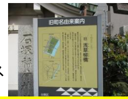
旧柳橋町名由来案内