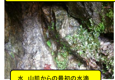
水 山肌からの最初の水滴