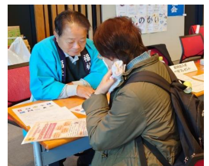
いろいろな方と交流できました。福祉会の活動をお知らせしました。理事長・副理事長もアンケート実施した