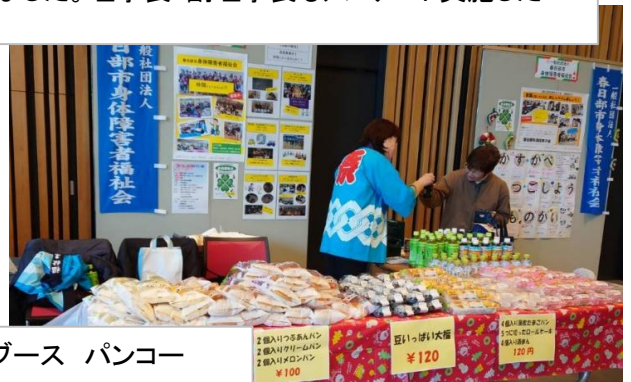
お隣は「春日部笑おう会」 福祉会ブース パンコー