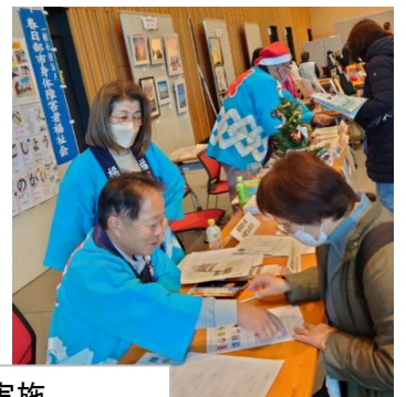
スタンプラリーでコーナーに集客・障がい者マークアンケート実施