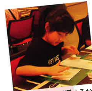
可愛いかぼちゃが描けるかな♪