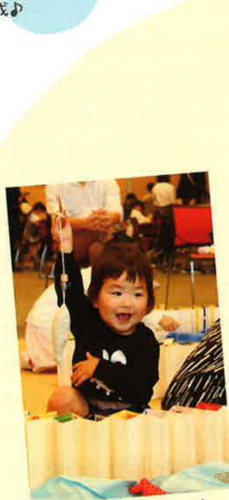
おさかなつれたよ!