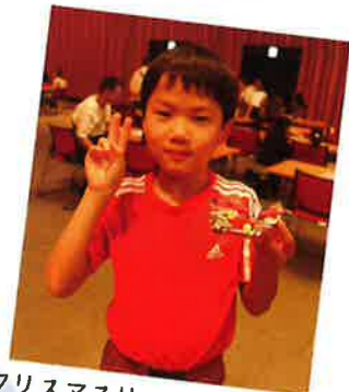
クリスマスリースが出来たよ!