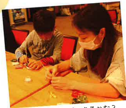
可愛いリースができるかな?