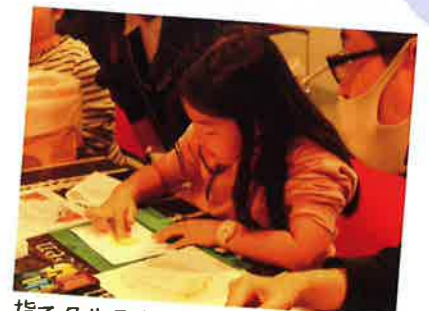
指でクルクル。どんな絵になるかな。