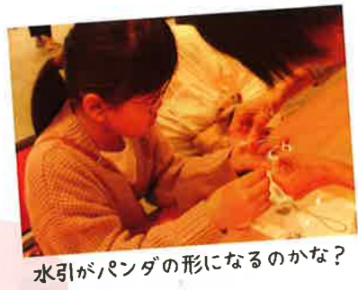
水引がパンダの形になるのかな?