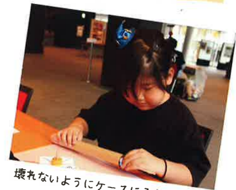
壊れないようにケースに入れましたよ