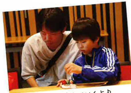
丁寧に布を刺していくよ♪