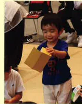
牛乳パックのビックリ箱♪