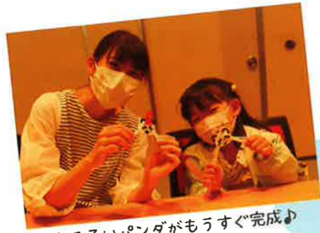
おそろいパンダがもうすぐ完成♪