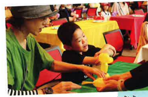
黄色い風船は何になったのかな♪