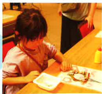
どんなリースにしようかな♪