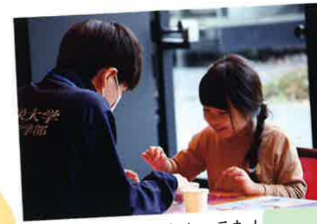
ワクワクしちゃうね!