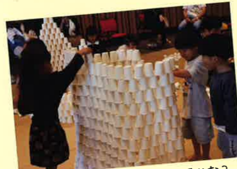
みんなで協力して何が出来るかな?