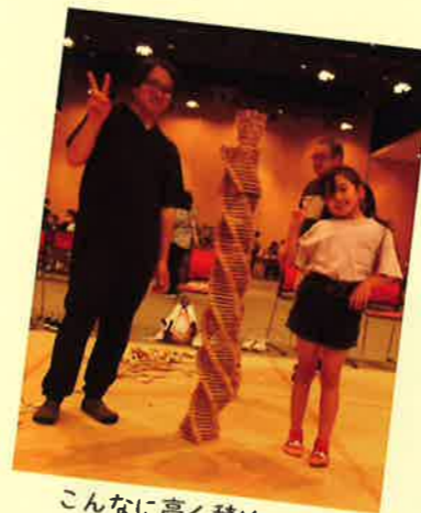
こんなに高く積めたよ。