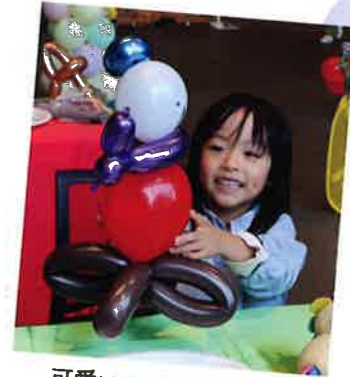
可愛いのが出来たよ!