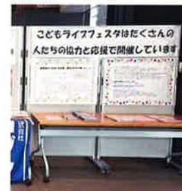
(10/27会場での掲示の様子)