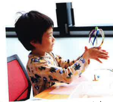
クルクル回してみるよ♪