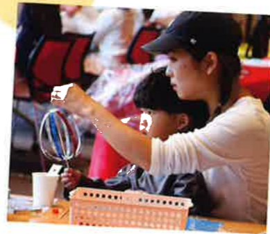
てっぺんに可愛いポンポンをつけるよ♪