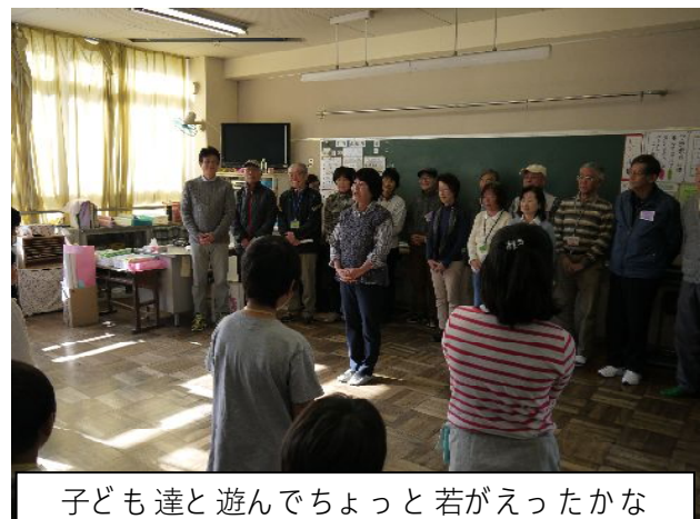
子ども達と遊んでちょっと若がえったかな