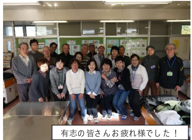
有志の皆さんお疲れ様でした！