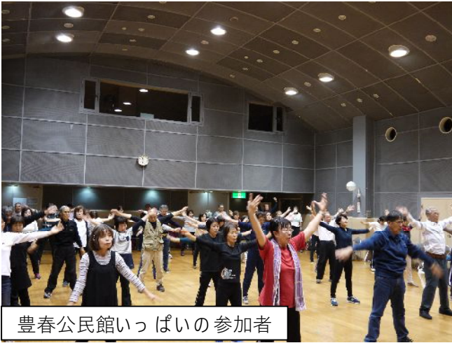
豊春公民館いっぱい参加者