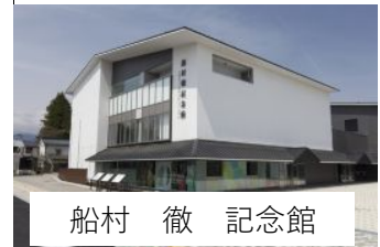
船村 徹 記念館