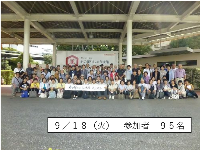
9 / 18 (火) 参加者 95名