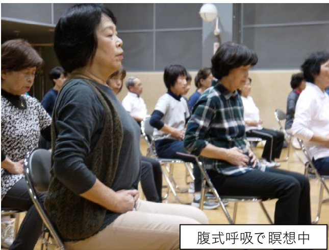
腹式呼吸で瞑想中