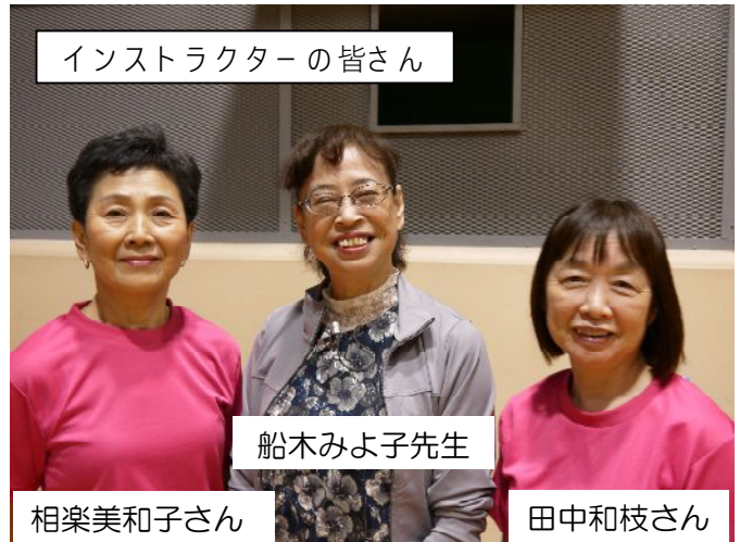
インストラクターの皆さん