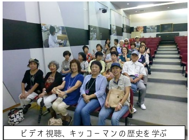
ビデオ視聴、キッコーマンの歴史を学ぶ