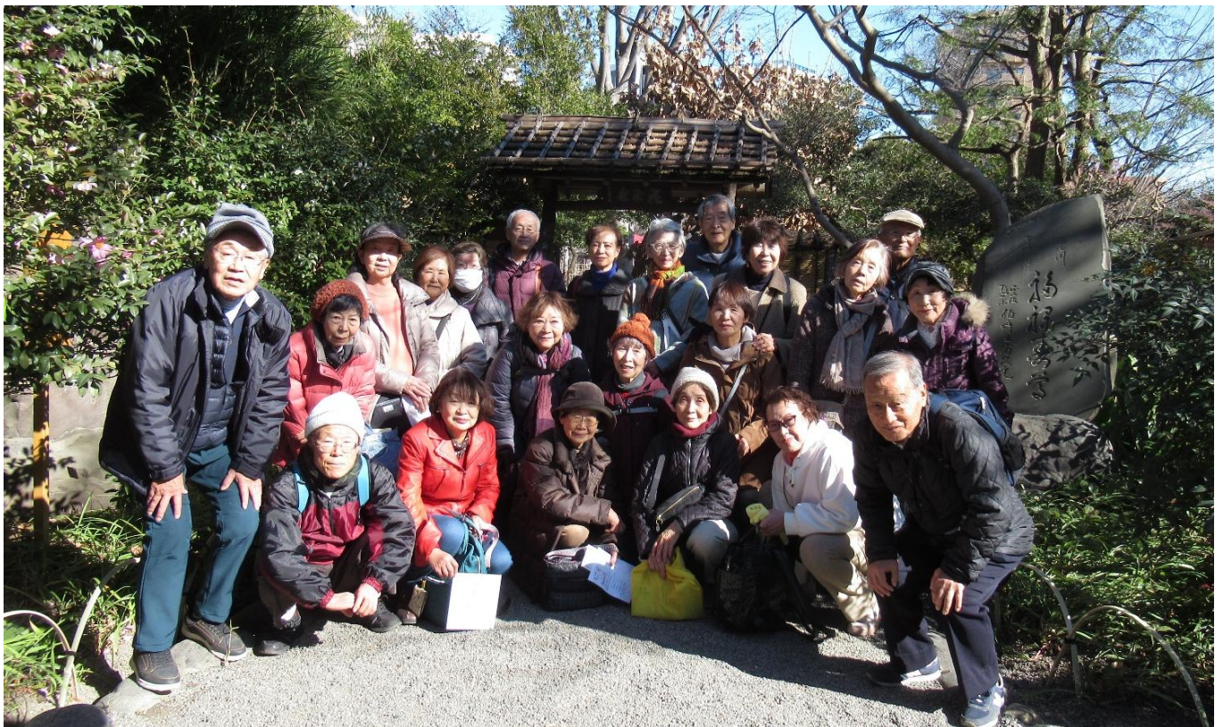
3ヶ所目の向島百花園（福祿寿尊） 門前にて