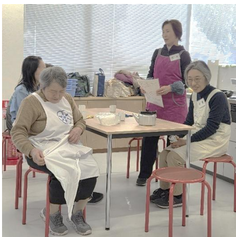
和気あいあい・・・と