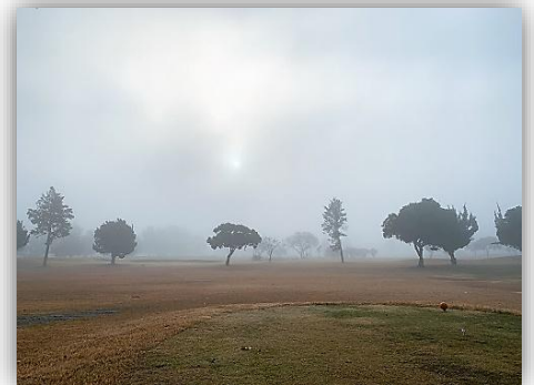
朝霧で真っ白なコース