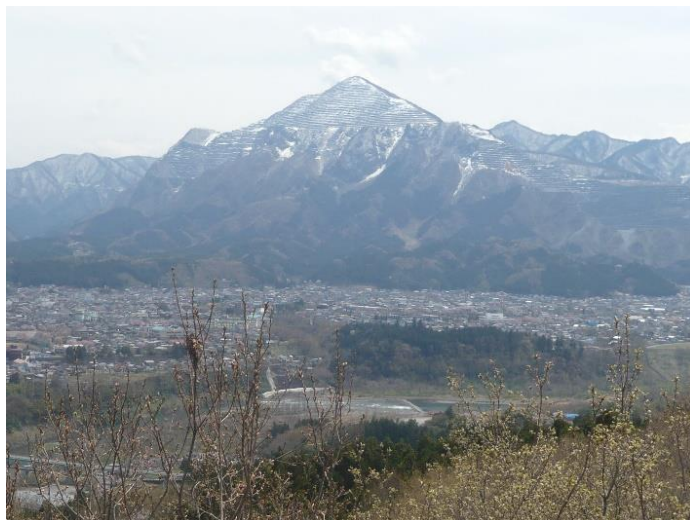
秩父の名峰武甲山 1304m