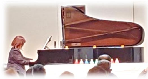
20期 中倉 八重子