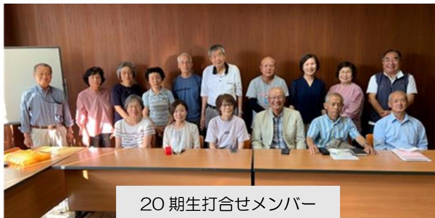
20期生打合せメンバー

さて、打合せで決まったことは20期同期会の発足、そして2回目の同期会の活動は7月28日（金）11:00～昼食会を魚元で実施する、こととなりました。