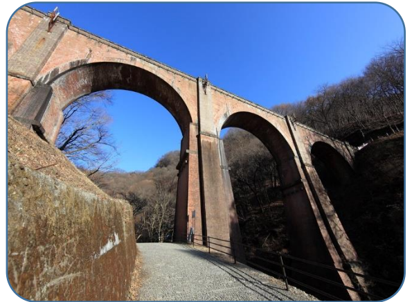
レンガ造りのめがね橋