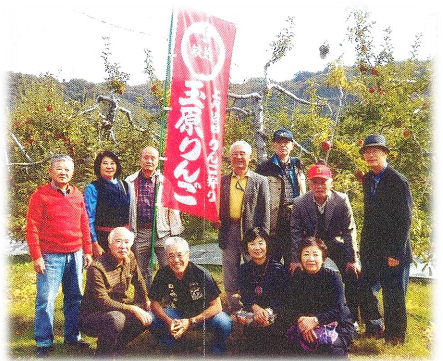
羽鳥りんご園にて

未来永劫、永遠と続くものであるがその中において我々の接触、触れ合いは旅人のようにほんの一瞬、一期一会、刹那のことである、それ故になお一層大切にしなければいけない。」偶然の出会い故、お付き合い、仲間との交友は今後とも大事にしたいものだと思っています。