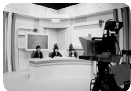
アナウンサー体験