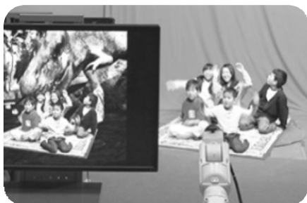
大人気! 「空飛ぶ魔法の絨毯」

SKIPシティ(スキップ・シティ)は、埼玉県川口市にある映像制作を目的とした施設。NHK川口ラジオ放送所跡地の産官学連携による再開発事業として、2003年2月1日にオープン。SKIPIは、英語：Saitama Kawaguchi Intelligent Park の頭文字