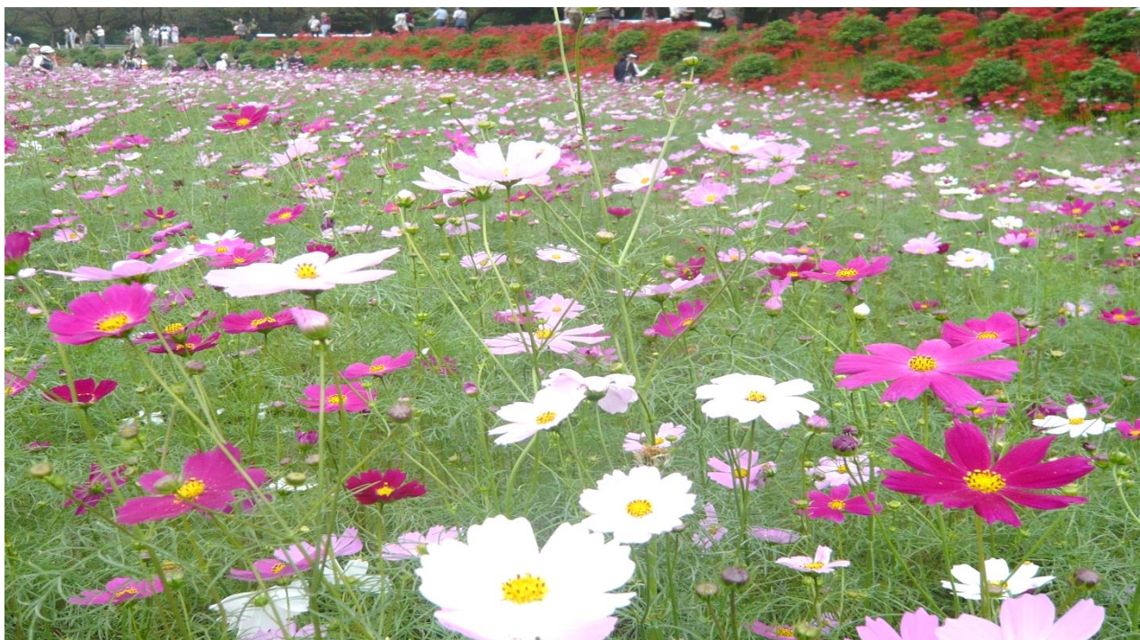
＜コスモスと曼殊沙華 巾着田＞

春日部市庄和地区市民大学 学友会（卒業生会報） 会員数 126名 2022.8.31 現在