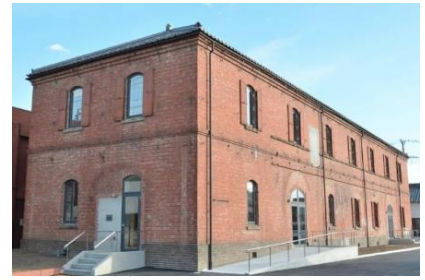
旧本庄商業銀行煉瓦倉庫