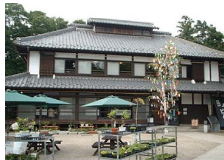
べに花ふるさと館

桶川は近隣で生産される農産物が集まる場所として賑い、中山道の宿場として栄えました。特に「桶川臙脂（おけがわえんじ）」と呼ばれたべに花の生産が盛んで、べに花で財を成した商人の家など、江戸時代の建物が中山道沿いに多く残っています。人口約7万4千人