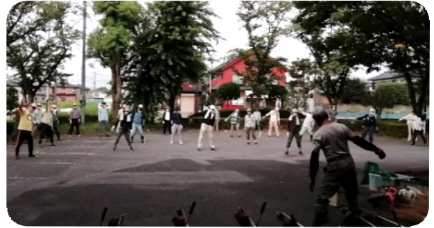
清掃活動前に皆でラジオ体操