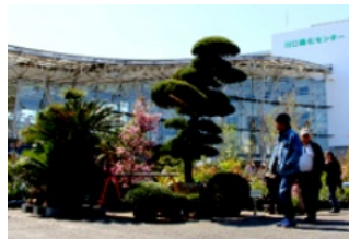
川口グリーンセンター