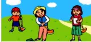
グラウンド・ゴルフを一緒に楽しみませんか？

7月度のグラウンド・ゴルフ部、月例会は雑草が虎刈りで、グラウンドコンディションが悪い中、19・20期生の女性参加者が多く、プレ - しましたがホ - ルインワンが珍しく1名でしたので「特別賞」を16名と多くの方へ授与しました。