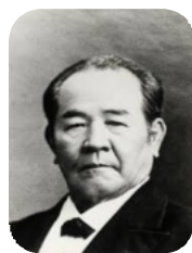
渋沢栄一 新一万円札は 2024年に発行 されます。

*交通費 南桜井 深谷 ¥1,225 バス¥200 *参加費 ¥200 問 合 せ 1~6期 宮武、7~9期 新井 10~13期 岡崎、14期~ 小林敏