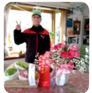
少し元気になった米三氏

(編集部より) 皆さまへの感謝の意を伝えたいと、2ヶ月連続で投稿いただき、掲載となりました。