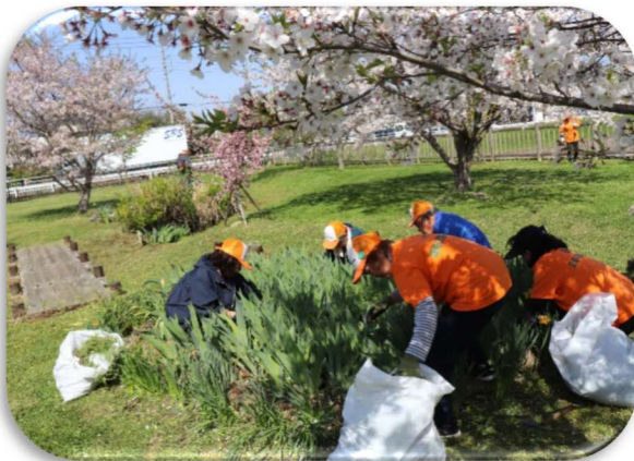
公園・花壇の除草、ゴミ拾い