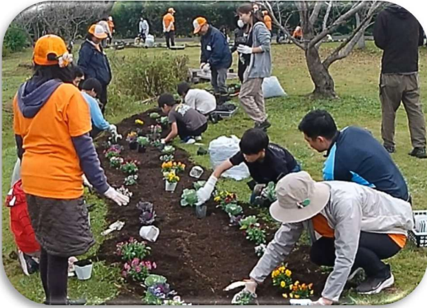
葉ボタン 192 鉢、ビオラ 192 鉢 を植えました

昨年、11月16日（土）道の駅庄和さくら公園で開催されました。今回のイベント参加者は社会福祉法人・子供の町の皆さんで、児童13名・職員5名に会員21名でした。なごやかで楽しいひと時をもちました。