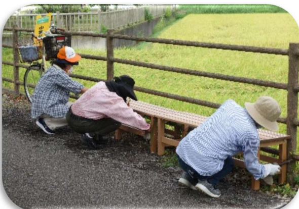
桜並木・ベンチ23台の清掃