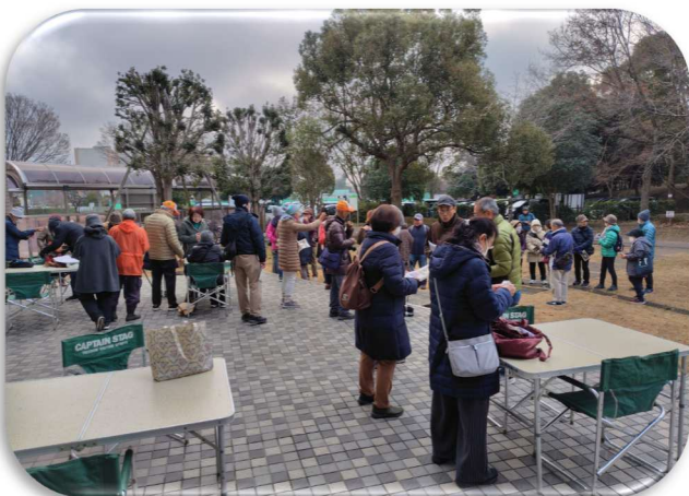
庄和支所前集合、バートウォッチング 用の単眼鏡まで準備いただきました。

いつもは何気なく眺めている動植物に、いろいろな特徴があることを説明いただき、楽しい学びの時間となりました。公園に次に訪れる際は、ちょっと違った感覚で公園を散歩するという声に参加者からありました。