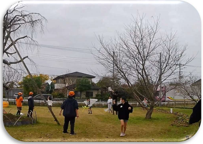
子供たちは描いた凧を走って揚げました