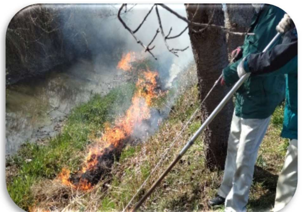
用水路の野焼き、ゴミ収集