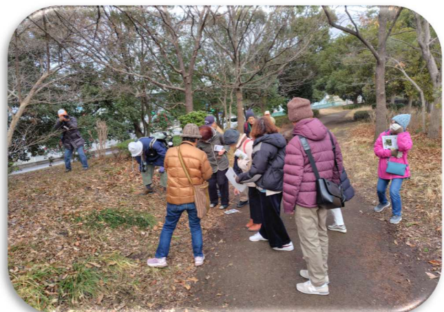
この木、何の木？という感じで 聞き入っておりました。