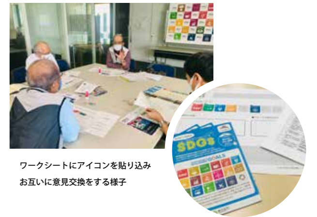
ワークシートにアイコンを貼り込み お互いに意見交換をする様子

ぽぽら春日部では、登録団体の皆さまとSDGsを学びながら、共に持続可能な地域社会づくりに貢献できるように今後もさまざまな機会をつくっていきます。