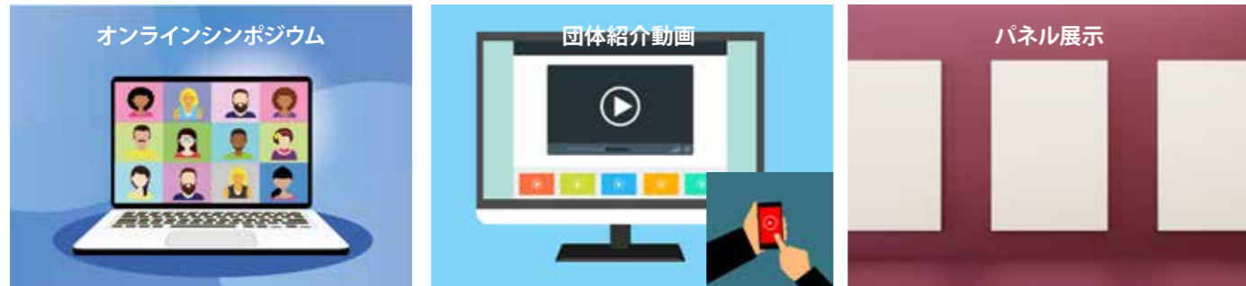
【昨年度を参考にした取り組み例】