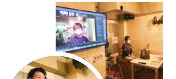
タマシの会のお二人が 司会進行してくれました