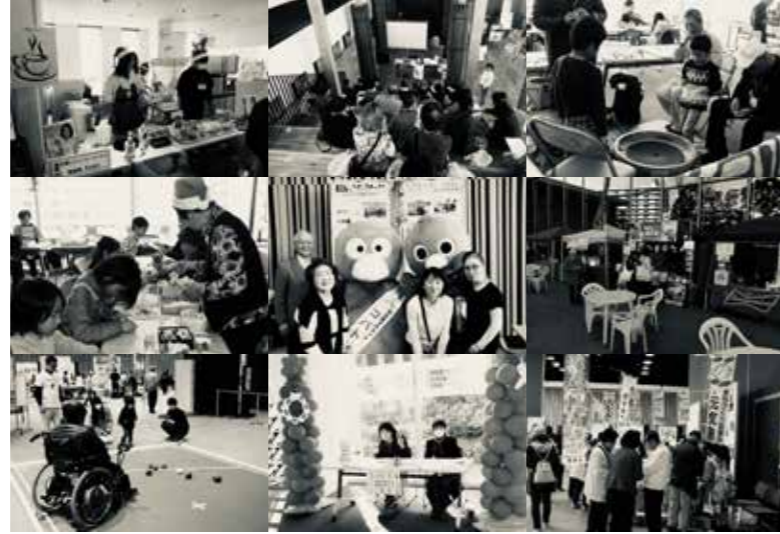
※過去の開催の様子

昨年県内でもいち早くイベントの開催を決め、動画の活用やオンラインの併用等の新たな取り組みが注目されたぽぽらフェスティバル。今年も昨年の取り組みをベースに、実行委員の皆さまと節目のぽぽらフェスティバルを盛り上げていきたいと考えていますので、利用者及び登録団体の皆さまもご協力をお願いします。