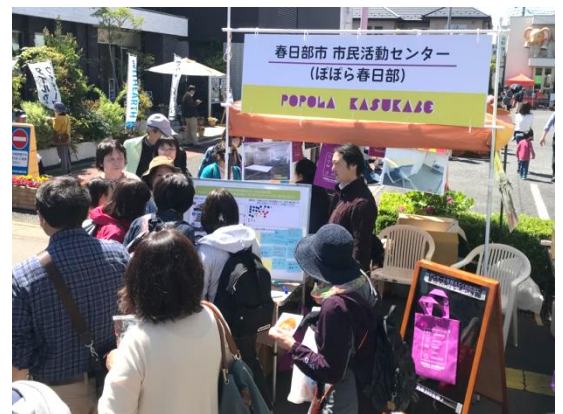
当日のブースの様子