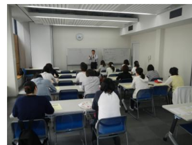
↑セミナーの様子です。

一般社団法人感動プロジェクトは、「人づくりのトータルサポート」を目的とし、3年前に立ち上げました。昨年度からは「春日部市就労支援事業」と連携しながら就職相談や就職セミナー等を実施し、求職者のサポートを行っています。さらに、今年度から厚生労働省事業の「かすかべ若者サポートステーション」を受託し、働くことに悩みを抱えている15歳~39歳までの若者の就職を支援しています。現在5名のスタッフで、市民活動センターの貸事務所1を拠点に、就職活動の相談や就職に向けた各種プログラムを実施しており、多くの方に利用いただいています。