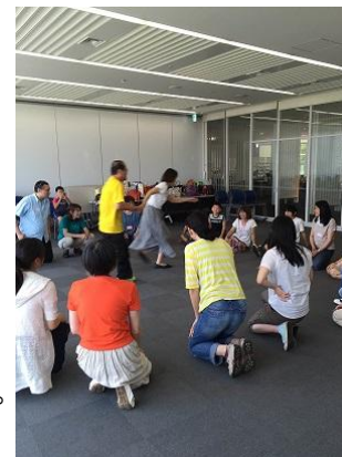
↑明るく楽しく活動しています！

「教わる」のではなく、ゲームやことばのまねっこなど、赤ちゃんからシニアまで、誰でもできる楽しい、多言語の自然習得(母語の獲得プロセス)活動を行っています。家族で活動するのが特徴です。時にはホームステイを行ったり、その体験をシェアしあったりもします。