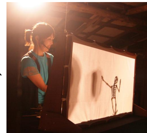
【影絵屋 SAKURA による影絵の様子】