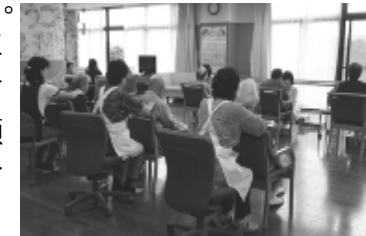
豊潤館にボランティアに行きました↑

私たちが笑顔で皆様にお届けしています。受ける側も施術する側も笑顔になる、癒し癒されるケアです。