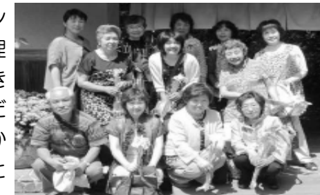
↑明るく元気に活動しています！

私たちのボランティア活動を理解していただき参加していただけるよう呼びかけていきたいと思ひます。