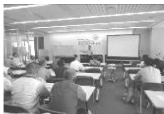
↑春日部市内の被害額はなんと約1億2400万円！(講座当時とても驚きました。)

警察の方から市内の状況の講演をいただいた後、「NPO法人春日部教育フォーラム」が、振り込め詐欺の手口を実演し、参加者は身近にある危険を学び、有意義な時間を過ごしました。