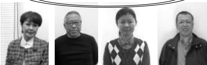
「ぽぽら春日部」運営パートナー 印刷担当メンバー