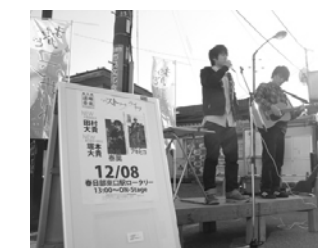
第4回ストリートライブの開催風景（2012年12月8日）

11月に行われる「春日部音楽祭かすかべまちかどコンサート」の運営、マネジメントをしており、参加会場の店舗を5月下旬より募集しますので、詳しくは春日部TMOホームページをご覧ください。 (http://www.tmo-kasukabe.com)