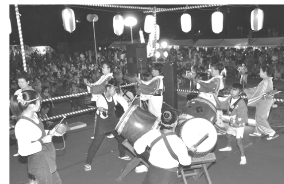
盆踊り・阿波踊りは参加自由!一緒に踊りましょう♪