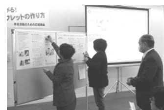
共感ポイントにシールを張ろう

参加者からは、「団体の活動に合わせた作り方があることがわかりました。ぜひ作ってみたいです」との声が聞かれました。