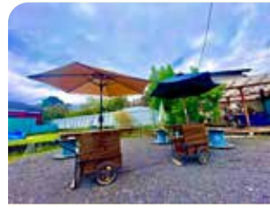
※リヤカーゴイメージ

今年は過去最大の56の市民団体が参加。10/24に開催された第7回実行委員会には、春日部市保健センターやふれあいキューブの運営事務局も参加し、スタンプラリーの実施方法やチラシ・のぼり旗の制作等について意見を交わしました。今年はイベントをさらに賑やかにするために移動式屋台「リヤカーゴ」でちょっとした飲食も提供予定。11/30（土）に行われるプレイベント（ララガーデン春日部 1F イベントステージ 11:30 開始）を皮切りに参加者皆でフェスティバルを盛り上げていきましょう！