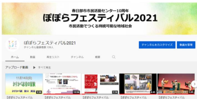
昨年のYouTubeチャンネル