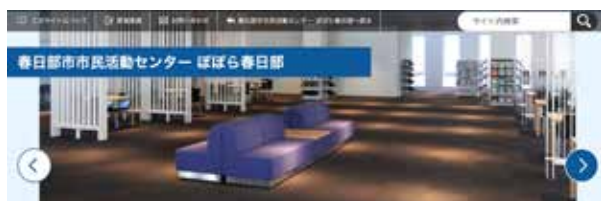
※写真はイメージ図